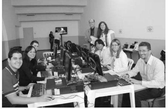
つうしんたんとうしゃ 「インターネット通信担当者」