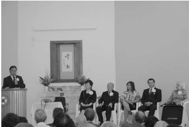
あらまききょうかし ぶちよう かいかい 「荒牧教化支部長による開会のあいさつ」