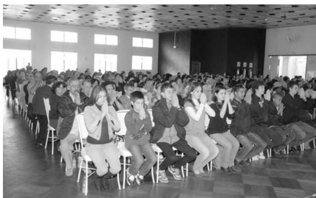
「感謝の真心を込めて祈る参加者」