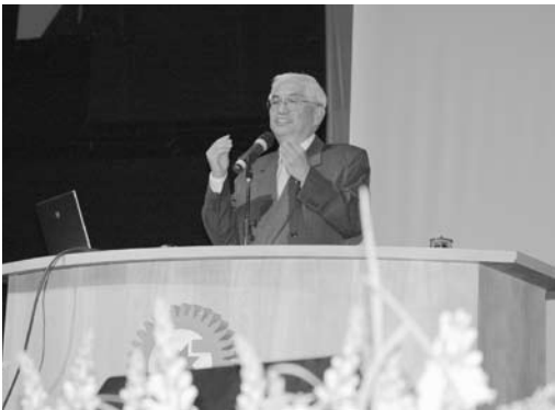
「おののでらほんぶこうしほ 小野寺本部講師補」