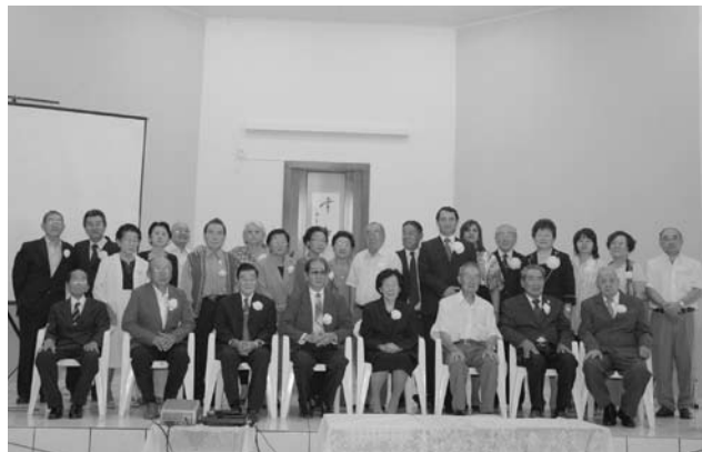
ひょうしょう こうろうしや 「表彰された功労者」

じ もとせいちやう いえ こうけん かたがた 地元生長の家のために貢献された方々へ かんしゃ ことば の なか すで しょうてん 感謝の言葉を述べ、「中にはもう既に昇天さ れている方もおられ、霊界から皆様に拍手 を送られているに違いない」と話した。