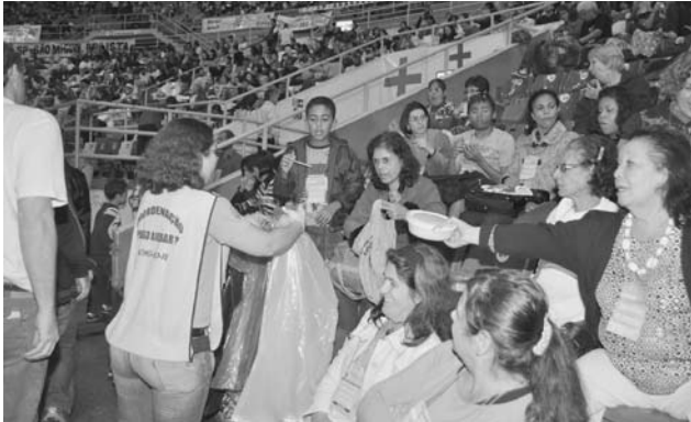
ぶんべつ きょうりょく 「ゴミの分別に協力」