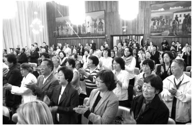
「使命行進曲を斉唱する参加者」

去る8月12日(木)午前9時より、サンパウロ市議会議事堂内で『生長の家の日』を祝う記念式典が行なわれた。当日は、好天に恵まれ、来賓や関係者を含めて約145名が参列された。式典は、1997年制定されて以来、今年で14回目を迎え、同所内の専属放送局であるTV CÂMARA局より式典が収録された。