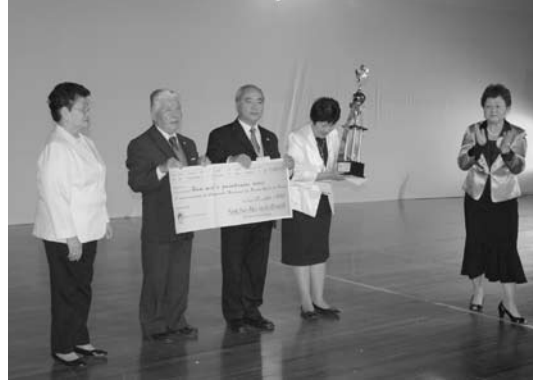
「団体賞 二位の 聖市第1」

こうわ し むかいよしお ほんぶ こうし 講話の締めくくりとして、向芳夫本部講師 ほんとう しゅうきやうてきすく い こんたいかい が “本当の宗教的救いとは、と云う今大会