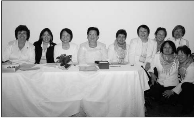
しろはとかい じつこうい いん みなさま 「白鳩会・実行委員の皆様」