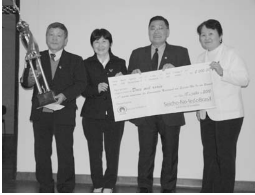
「団体賞 一位の パラナ第1」