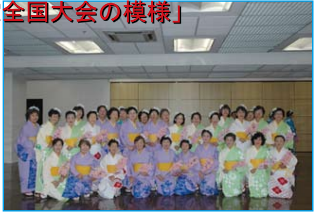
だんたいぶ よう ひろう しろはとかいゆうし みな 「団体舞踊を披露された白鳩会有志の皆さん」