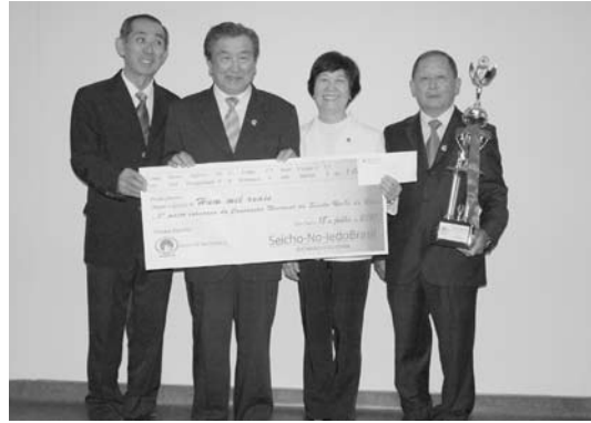
「団体賞 三位の パウリスタ第1」

のテーマに沿って講話をされ、外の世界は神 が内の世界を模写する。どんな境遇にいても こころがま の にんげんかみ こ しんり 心構え一つで伸びられる。人間神の子の真理 が自分の内に感じた時、良くならざるを得な いのです。生長の家を知って、御教えを知っ て多くの方たちが救われるのですと語られた。