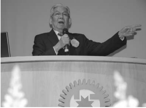
「むかいほんぶこうし 向本部講師」