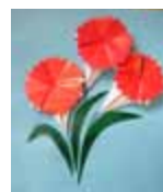
↑ ワークショップの風景 Workshop