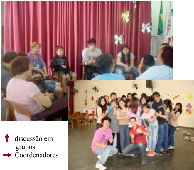
↑ discussão em grupos → Coordenadores